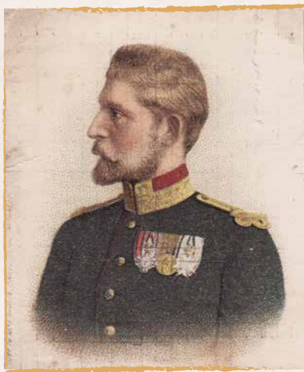
M.S.R. Ferdinand I al României