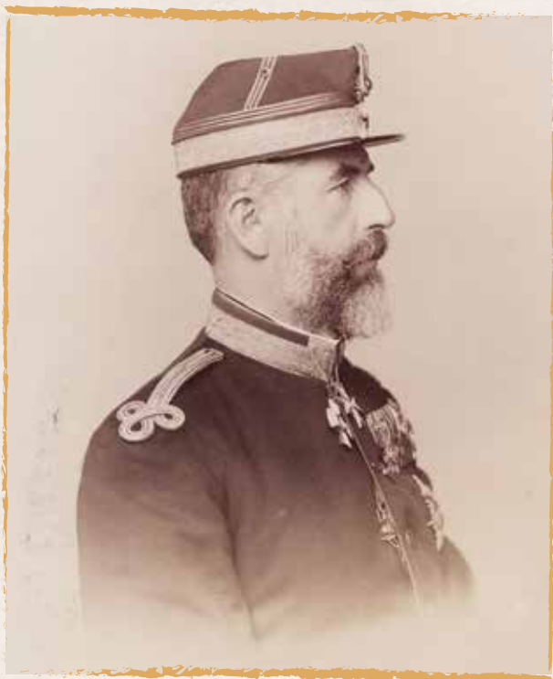
M.S.R. Carol I al României