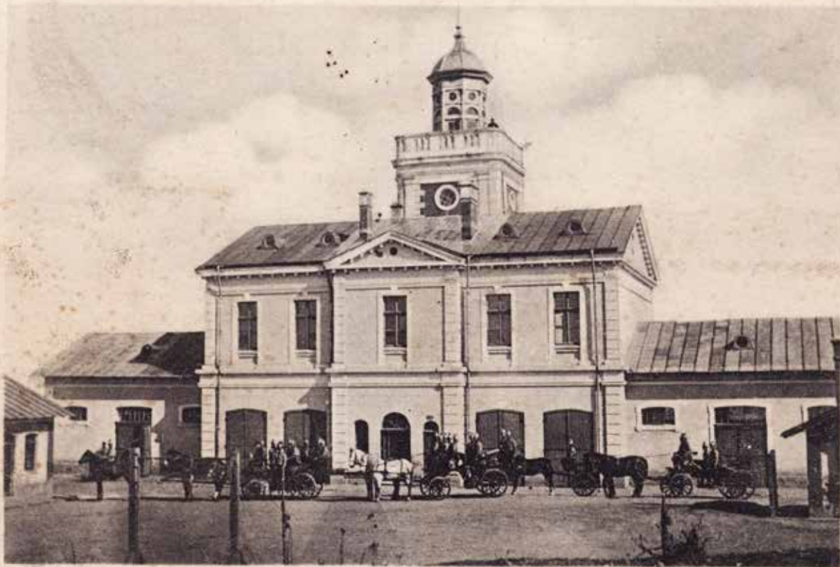
Foisorul de Foc — Pitești